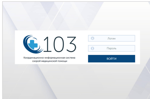
Рисунок 2 – Окно авторизации КИС ЕДЦ